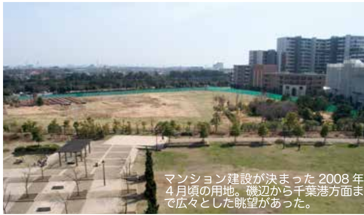
マンション建設が決まった2008年4月頃の用地。磯辺から千葉港方面まで広々とした眺望があった。