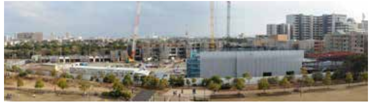
2013年3月 中層階（6階）だこのくらいの高さ。