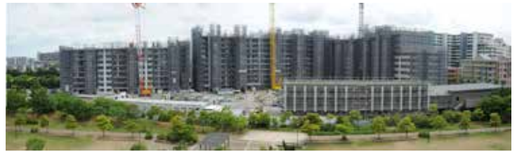
2013年6月 まだ上に向かって積み上げられている。