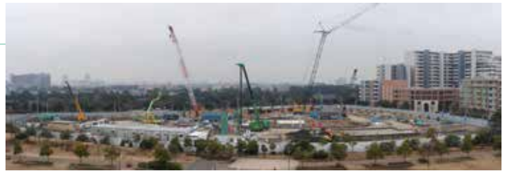
2013年1月 基礎工事中。ミキサー車の出入りが頻繁な時期。

（「グリーンナ」は現在この原稿を書いている時点（3月26日）ではまだ入居の引っ越しは行われていないようで、周辺の道路には工事車両が残っています。3月入居とチラシにはあったのでこのベイタウンニュースが配布される頃にはもう引っ越しも行われていると思われませんが現在は完成見込みの状態です）。【松村】