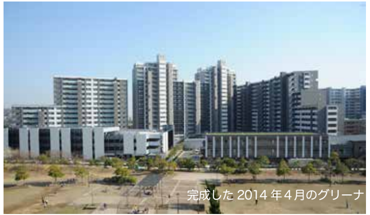
完成した2014年4月のグリーンナ