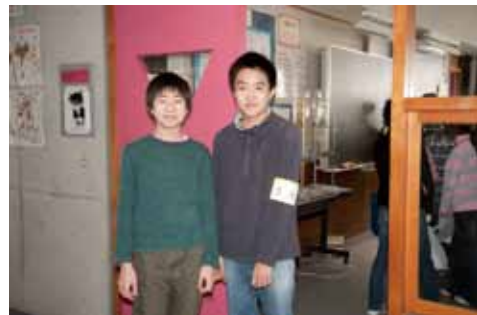
校内のあちこちで生徒会役員が案内

打瀬中3階屋上から学校全景を見る小学生たち。後ろにあるのはパラボラのようなのだが、アンテナではなくただのオブジェ。しかし小学生に限らず見る者に何か先進的なものを期待させる効果は十分だ。