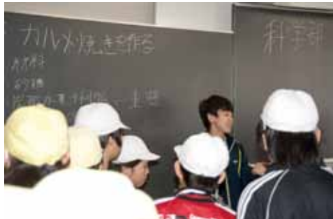
意外(?)に人気があった科学部の実験。

体験入学の日には新入部員の勧誘には絶好のチャンス。入学したら是非我がクラブへと先輩部員はプラカードを持つ（写真左上）。昨年県大会で金賞をとった吹奏楽部の歓迎コンサートには驚くほどの見学者があった（写真左）。野球部の練習見学に集まった6年生たち。「やっぱり中学の練習はきびしそう」という声も（写真上右）