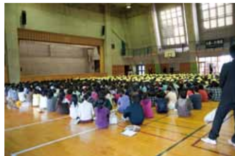
最初に全員が集まった体育館。

千葉市の小中学校では毎年「中学校体験入学」という行事を行っている。高校生が志望の大学を見るオープンキャンパスのような催しだ。ベイタウン唯一の公立中学である打瀬中学校でも昨年の12月3日（金）午後打瀬、海浜打瀬、美浜打瀬の3小学校の6年生全員を迎えて体験入学会を行った。中学校生活とはどんなものか。入学したらどの部活に入ろうか。興味津々で打瀬中学校内を見学する小学生に同行して取材した。【松村】