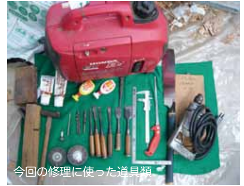
今回の修理に使った道具類

今年のベイタウン恒例のもちつき大会は1月9日(日)。何人もの手をへてベイタウンの新年もちつき大会に登場した白を見てみよう。【松村】