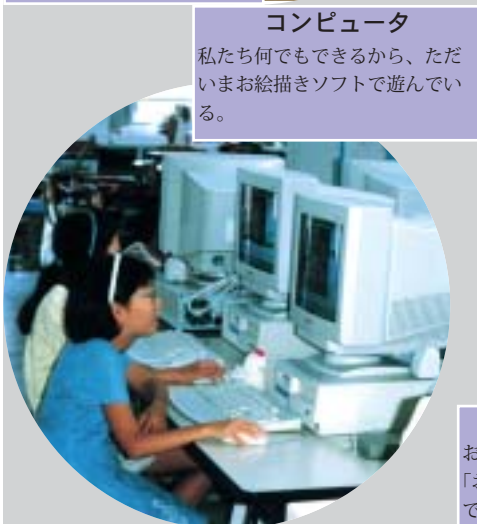
コンピュータ 私たち何でもできるから、たがいまお絵描きソフトで遊んでいる。