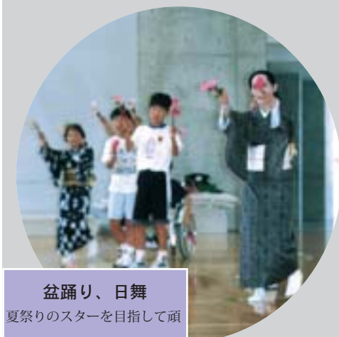
盆踊り、日舞 夏祭りのスターを目指して頑