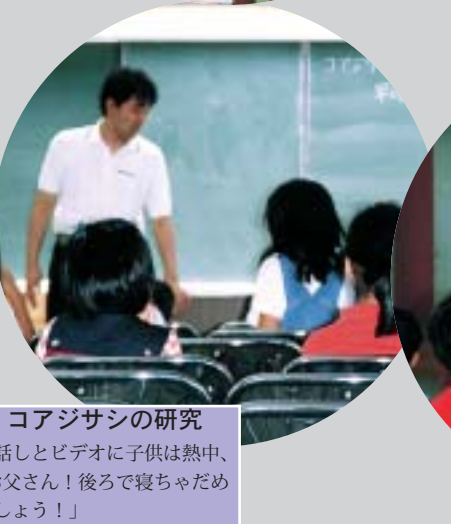
コアジサシの研究 お話しとビデオに子供は熱中、「お父さん！後ろで寝ちゃだめでしょう！」