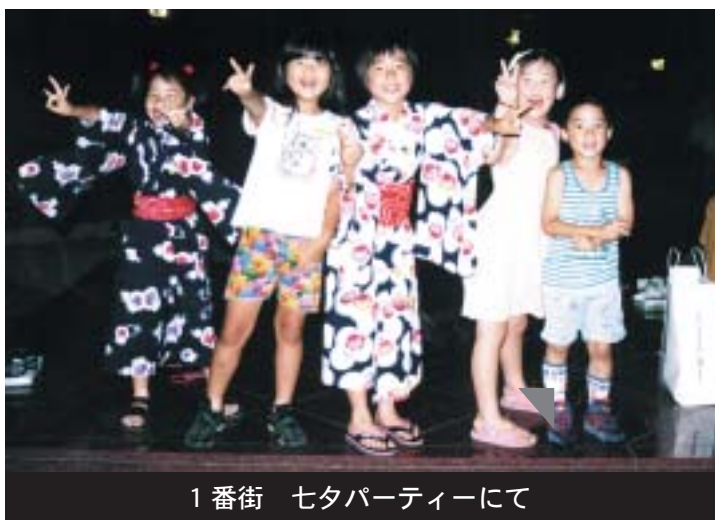
1番街 七夕パーティーにて