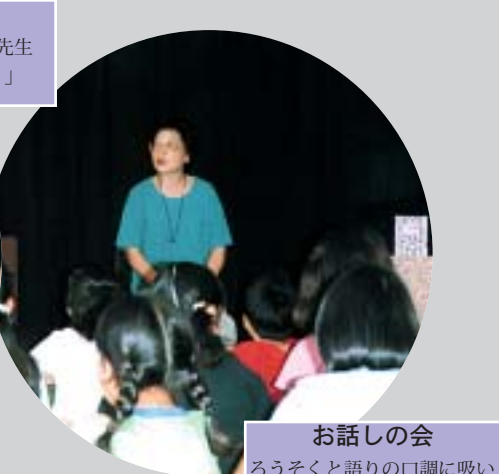
お話しの会 るうそくと語りの口調に吸い込まれ、みんな金縛り。