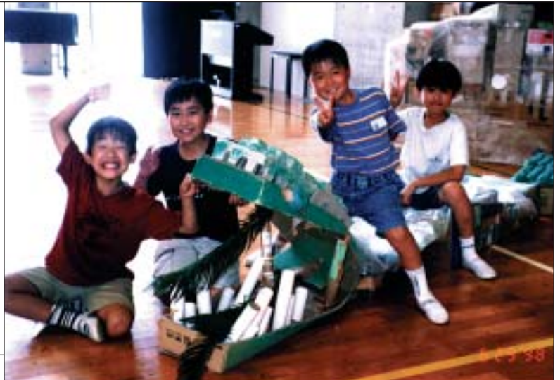
サファリパークの素敵なお仲間たち

アリーナギャラリーやコンピュータ室脇に素敵なお動物がいるのをご存じですか。長い首で優しく子供たちを見守るキリン、打瀬小の守り神のように長い体をギャラリーに巻き付けたへび、大空を悠然と滑空する鳥など。これらの作品は、4年生全員が6月に図工の学習で作りました。テーマは「大きなかばのなかまたち」。国語の学習「町に大きなかばがやってきた」の発展で、グループに分かれてかばの仲間を作ったものです。