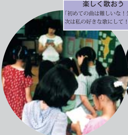
楽しく歌おう 「初めての曲は難しいな！先生次は私の好きな歌にして！」