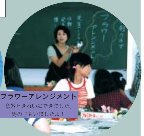
フラワーアレンジメント

「水草は折れやすいから爪を立てるな よ!」「でも試しに本当かどうかやっ てごらん。」