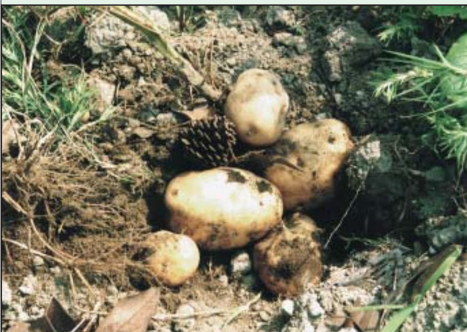
土の中からゴロゴロと出てくるジャガイモ