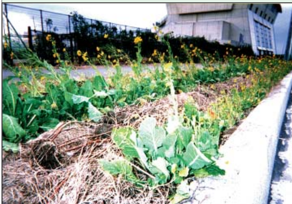
8月に蒔いた菜の花

そこで「菜の花」の力を借りようと思いました。「何の花」かと、疑問を持つだけでその中に解決が含まれている。